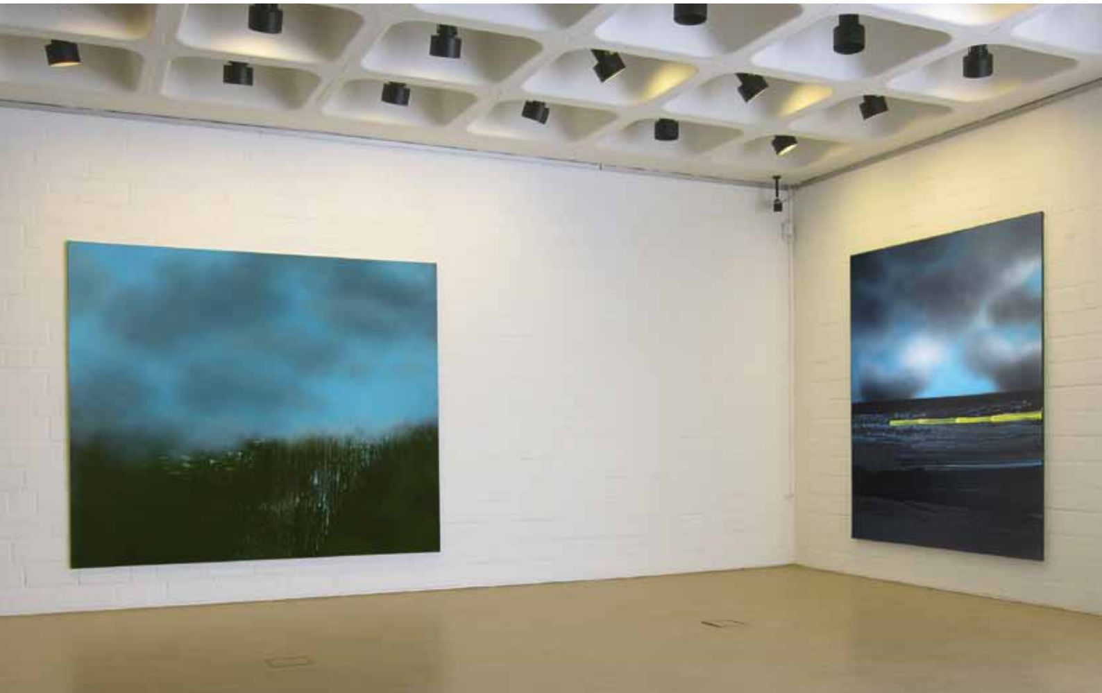
Städtisches Museum Kalkar, 2015