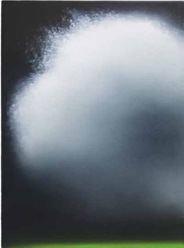
Nr. 379, 28 x 21 cm, Öl auf Holz, 2016