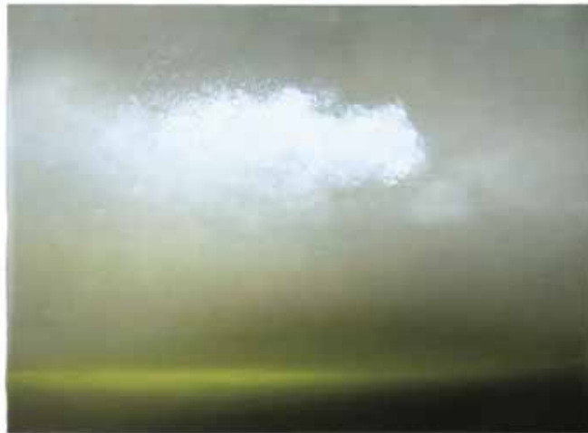
Nr. 357, 18,9 × 26 cm, Öl auf Holz, 2014 links: Nr. 382, 77 × 55 cm, Öl auf Leinwand, 2016