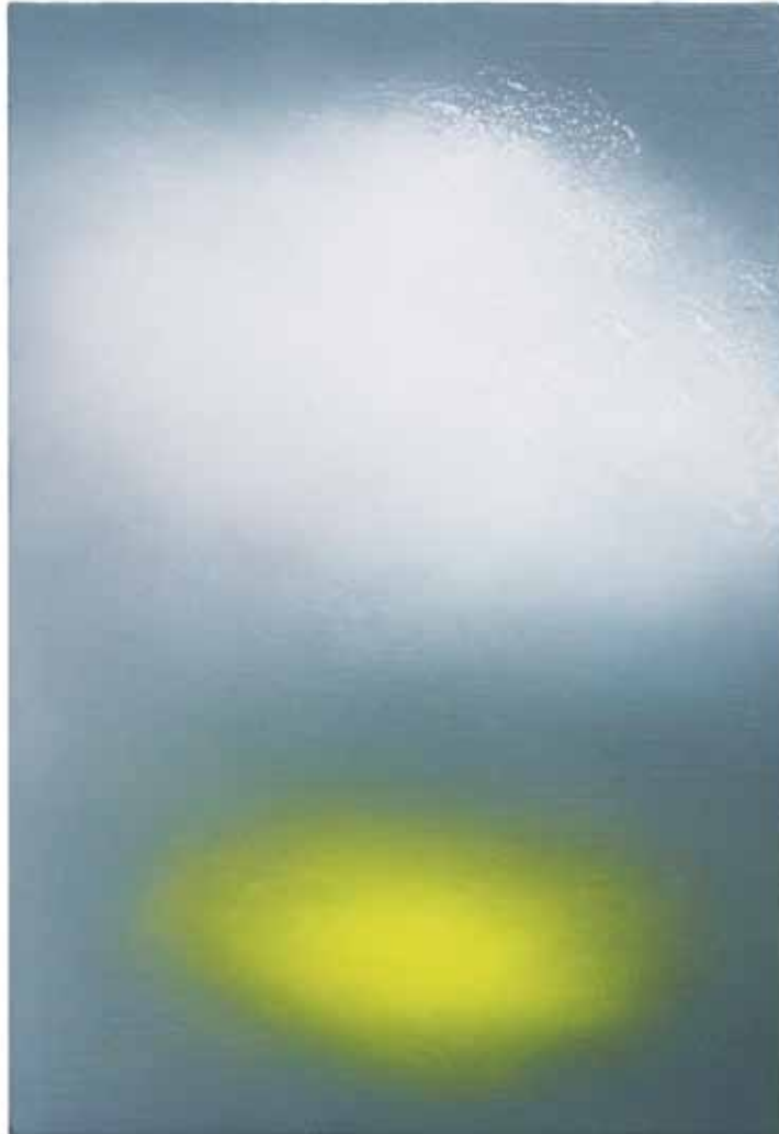
Nr. 374, 30 × 20 cm, Öl auf Holz, 2015 links: Nr. 369, 50 × 74 cm, Öl auf Karton, 2015