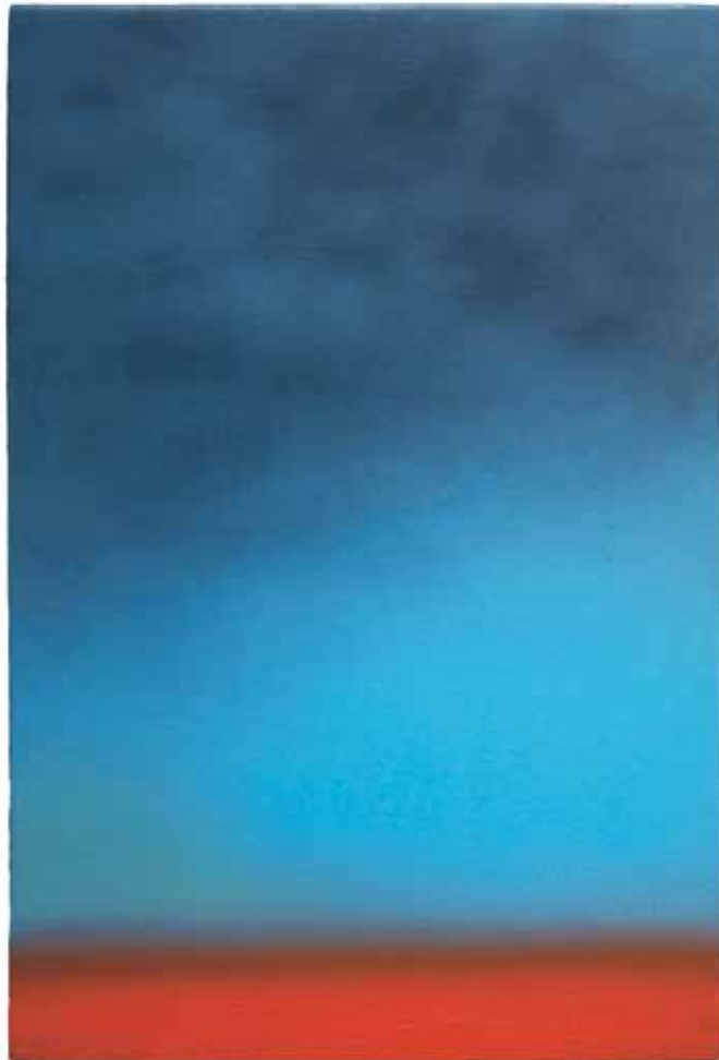
Nr. 380, 30 x 20 cm, Öl auf Holz, 2016 links: Städtisches Museum Kalkar, 2015