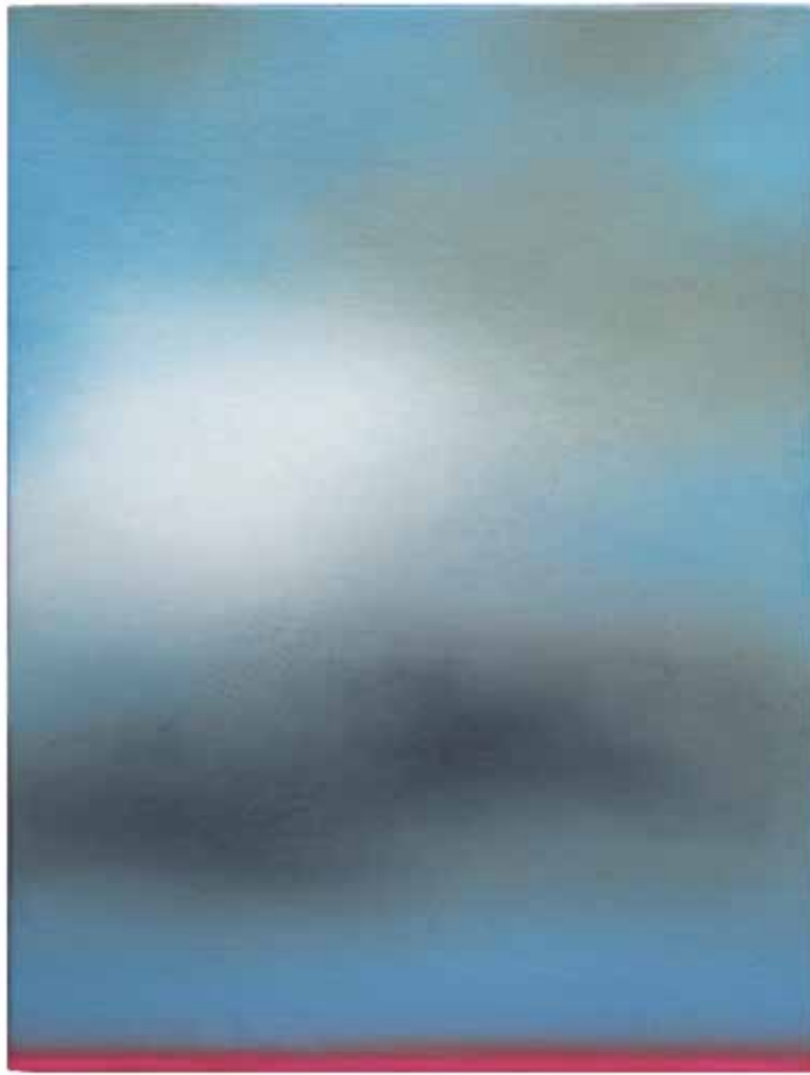
Nr. 378, 25,5 × 19 cm, Öl auf Holz, 2016